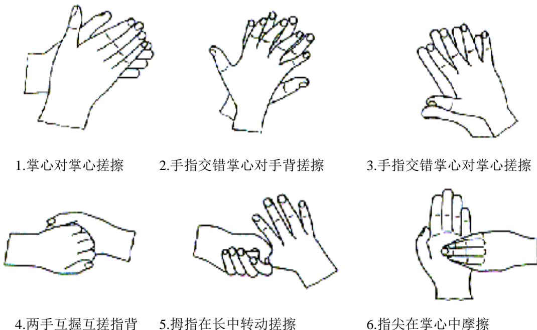
图 2-1 标准的洗手方法

(9)参考样品组: 对于卫生手消毒, 取 60%异丙醇 3 ml 到入手心中, 按标准的洗手方法用力搓擦 30s。以确保手的所有部位均匀接触异丙醇。重复使用异丙醇按上述方法搓擦使总的搓擦时间为 60s。对于外科手消毒, 使用 60%正丙醇 3ml, 按标准的洗手方法用力搓擦, 当接近干燥时, 再加 3ml 正丙醇搓擦。以保持作用 3min。用流动的自来水冲洗 5s, 抖掉手上残留的水。其余步骤与试验样品组相同。